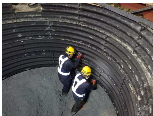
分水人孔③土留（ライナープレート）組立状況