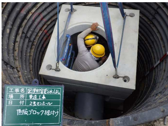
分水人孔②頂版ブロック設置状況

6月は、分水人孔②のマンホール設置、及び分水人孔③の掘削・土留工（ライナープレート）などを行いました。 7月は、引き続き、分水人孔②の埋め戻しを行い、分水人孔③の築造を行います。