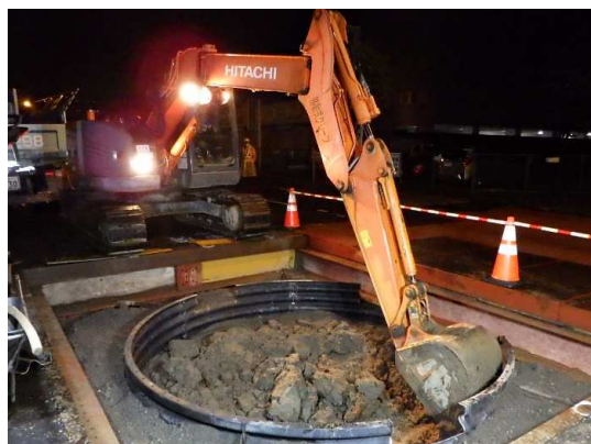
分水人孔③掘削状況