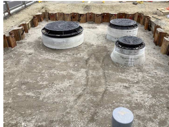
特殊人孔No.2埋戻し完了