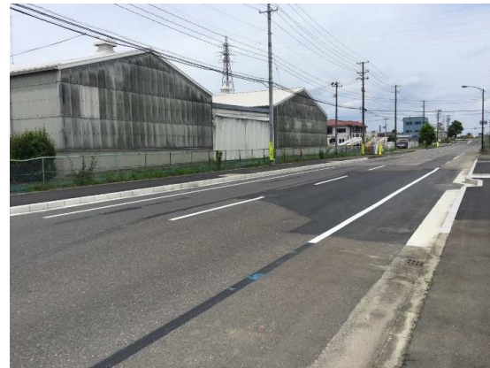
発進立坑舗装仮復旧完了