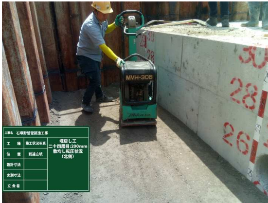
特殊人孔No.2埋戻し状況

6月は、到達立坑の特殊人孔・擁壁などの築造を行いました。 7月は、引き続き、舗装本復旧などを行います。