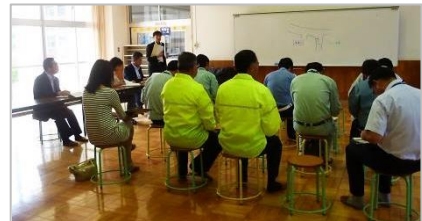
【対策協議会：高倉小学校】

合同点検終了後、高倉小学校で対策会議を実施し、点検結果に基づきどのような対策を行うべきかについて協議しました。各関係者は協議内容を踏まえ、今後実施可能な対策を行い、児童生徒の通学路の安全確保を図っていくことが確認されました。