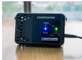
⑤小型軽量オゾン発生装置