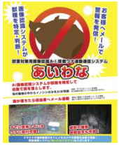
⑥獣害セキュリティサービス