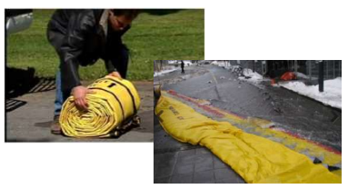
④防災・浸水対策製品