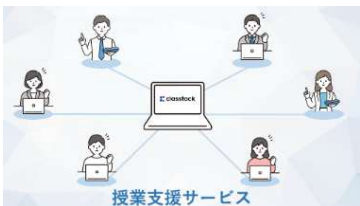
⑦授業支援アプリケーション