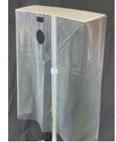
①内視鏡光源装置ポリカバー