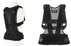
⑨放射線防護衣用サポートスーツ