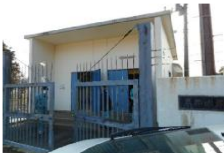
①取水施設(第1水源地)