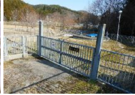
①取水施設(水源地拡大)