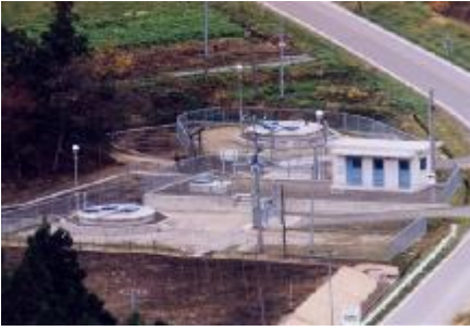
①取水施設(水源地全体)