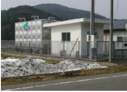
③一本木増圧ポンプ場