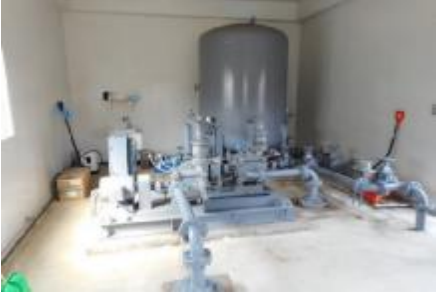
②配水池建物内部(圧力タンク)