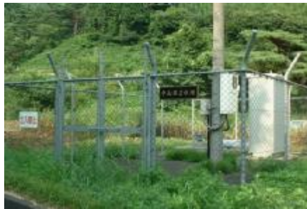
①取水施設(第2水源地)