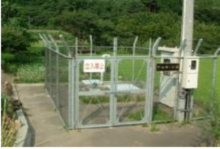
①取水施設(第1水源地)