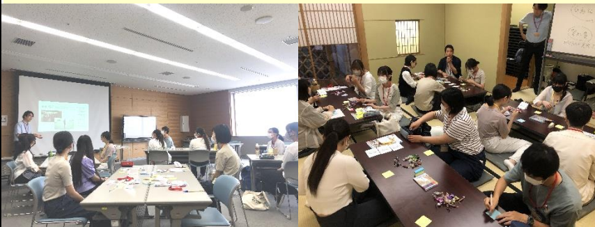
若者居場所づくり社会実験ワークショップの様子(2023年7月)

本市の市街地における若者居場所づくり社会実験にあたり、都市部との連携による効果向上を図る。