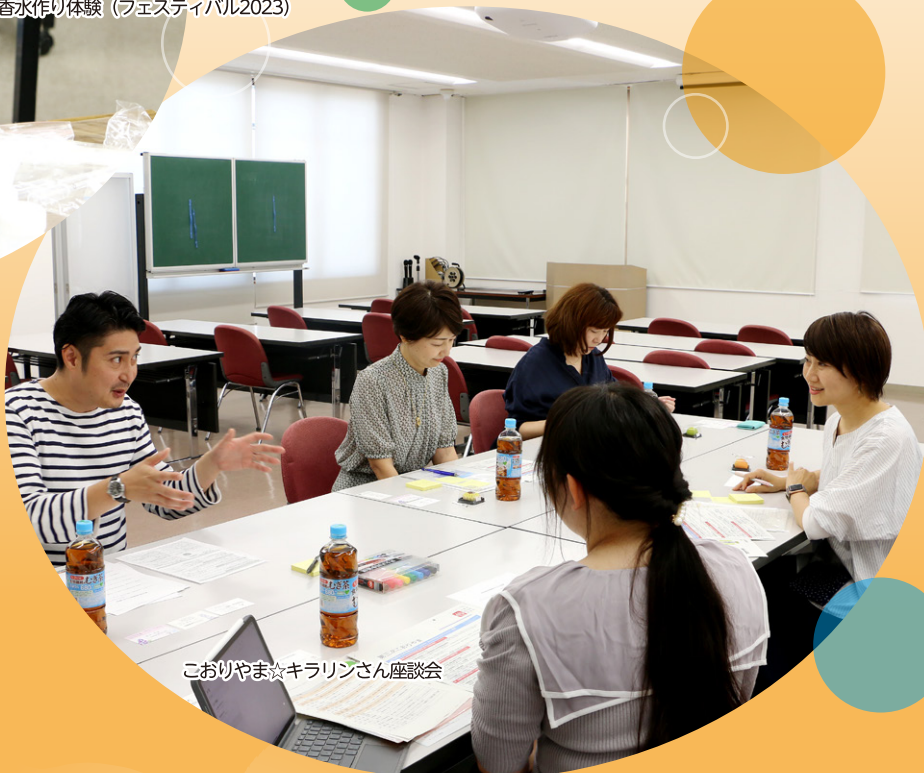
こおりやま☆キラリンさん座談会