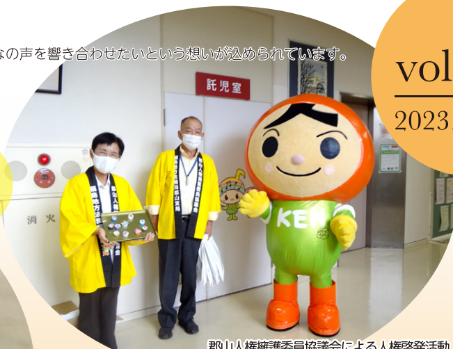
郡山人権擁護委員協議会による人権啓発活動