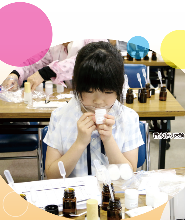
香水作り体験 (フェスティバル2023)