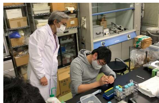
▲奥羽大学での成分精密分析