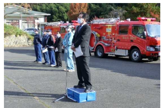
▲全戸調査出発式での会長挨拶