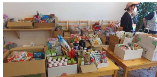
▲フードドライブに集まった寄付の品々