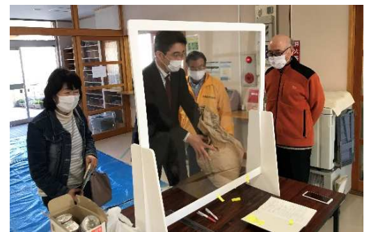
▲地域の方々から寄付を受付