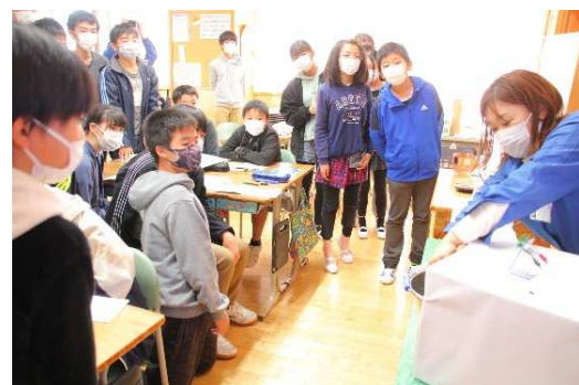
▲ステークホルダーと連携した質の高い教育