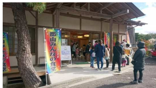
▲無料配布に並ぶ利用者の列