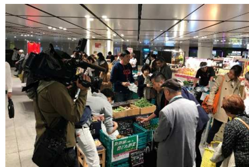
▲もったいない野菜マルシェ@東京駅