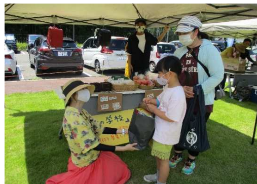
▲洋服と絵本を寄付