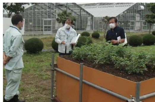
▲カンゾウ栽培試験