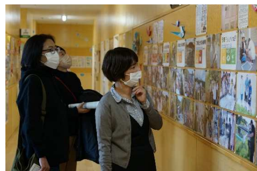
▲廊下のSDGsコーナーを見る保護者