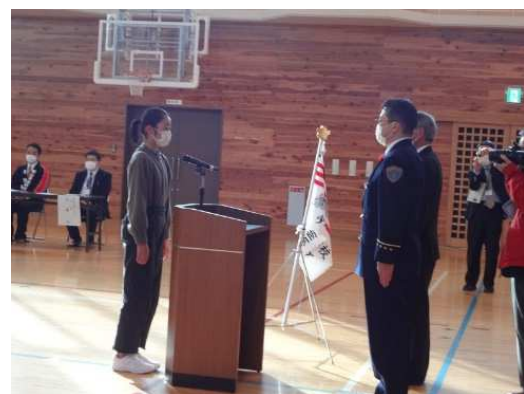
▲少年消防クラブの結成