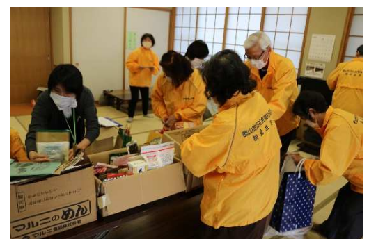
▲食料品・日用品・学用品が寄せられた