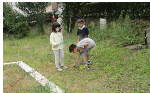
▲遊んだあとのごみ拾い