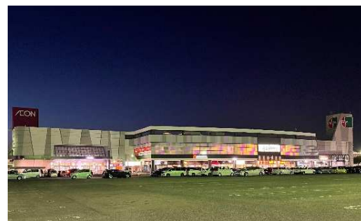
▲ライトダウンキャンペーン