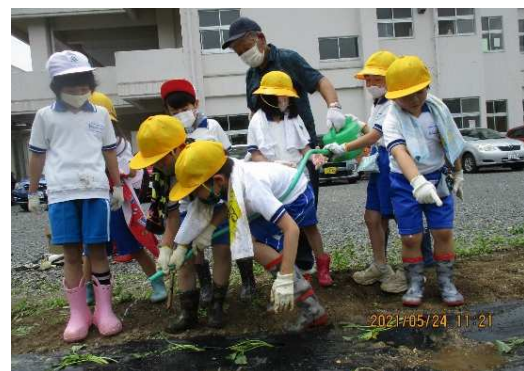
▲栽培活動を通じたSDGsの理解