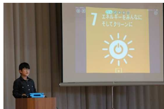
▲地域住民へSDGs推進を呼びかけ