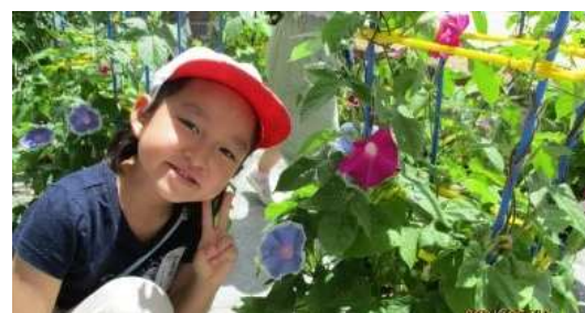
▲栽培学習による環境教育