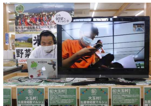
▲オンライン交流マルシェ