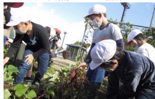
▲食と命の大切さを学ぶSDGs活動