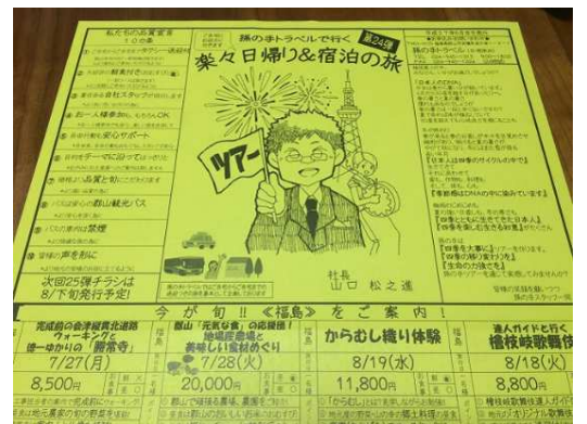
▲「孫の手ツアー」チラシ