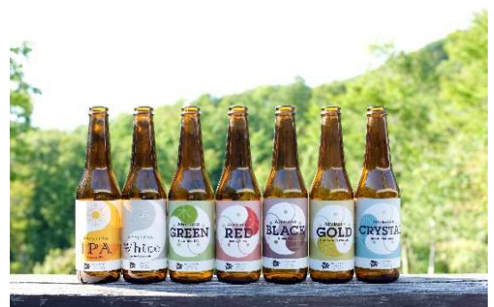
▲原料オール田村のビール