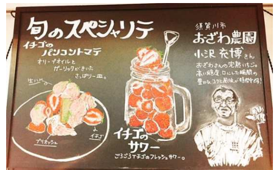
▲Best Table 旬のスペシャルリテ