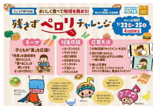
▲フードロスクイズ