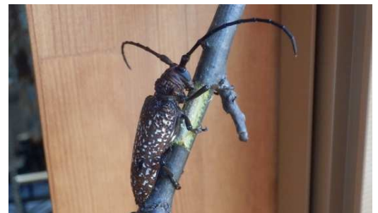
▲羽化したサビイロクワカミキリ