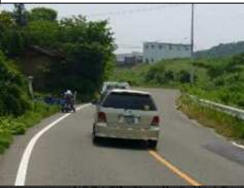
主要地方道 川俣安達線 (L≒1,000m)