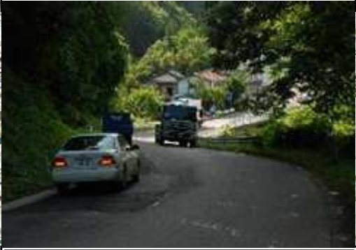
主要地方道 本宮三春線 (L≒300m)