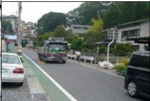
主要地方道 古殿須賀川線 (L≒3,300m)