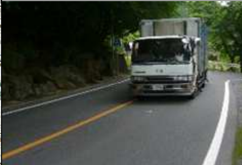
主要地方道 飯野三春石川線 (L≒3,000m)