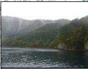
①通行不能区間現況