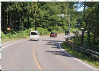
③猪苗代地区バイパス整備