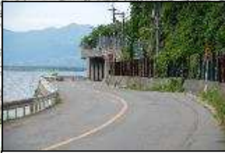
②猪苗代湖南線(上戸地区)