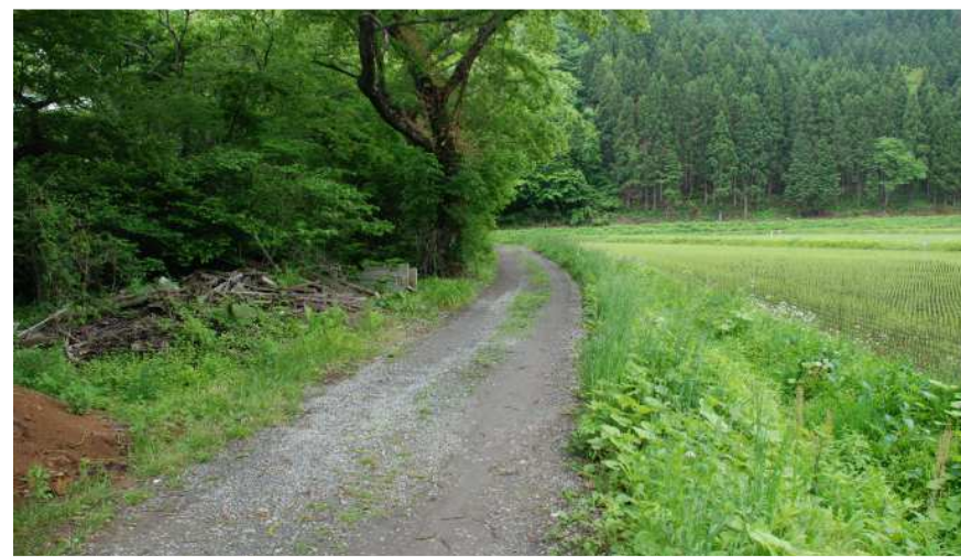
県道湖南湊線未整備区間