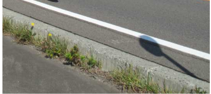
猪苗代湖と磐梯山 (国道49号)