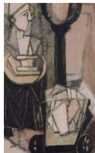
《はかりのある室内(石膏のある室内)》1952年/豊島区蔵