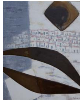
《スペインの幻想》1973年/福島県立美術館蔵