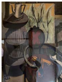
《椅子のある静物》1951年/個人蔵