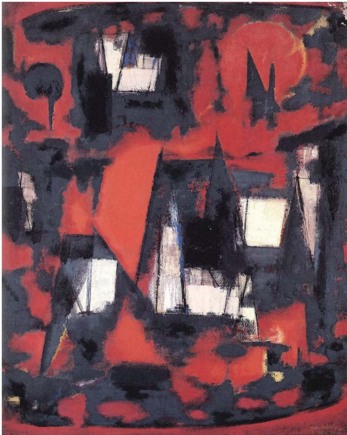
土橋 醇《イル・ド・フランス》1956年／郡山市立美術館蔵