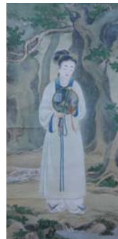
土橋 華城 《清涼》/福島県立美術館寄託