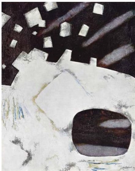
《流れる星(白)》1965年/東京国立近代美術館蔵