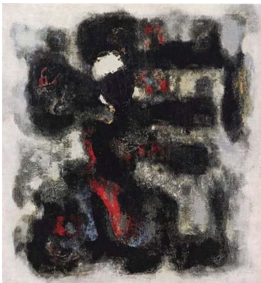
《火の誕生》1956年/神奈川県立近代美術館蔵