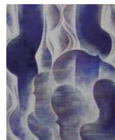
《流》1970年/福島県立美術館蔵