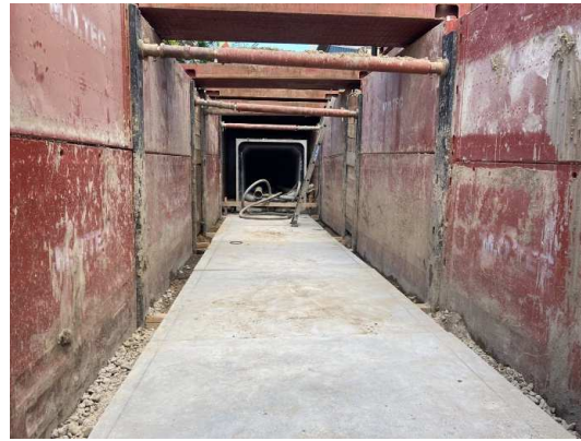
土留め・基礎版設置完了