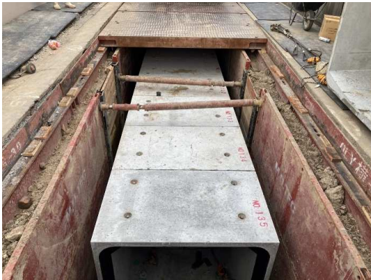
ボックスカルバート布設完了