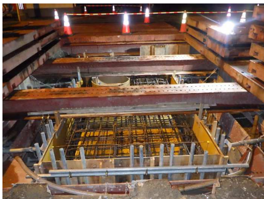
分水人孔③鉄筋・型枠組立完了