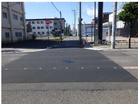
分水人孔②舗装仮復旧状況

8月は、分水人孔②の舗装仮復旧、及び分水人孔③の築造などを行いました。 9月は、分水人孔③の築造を行います。