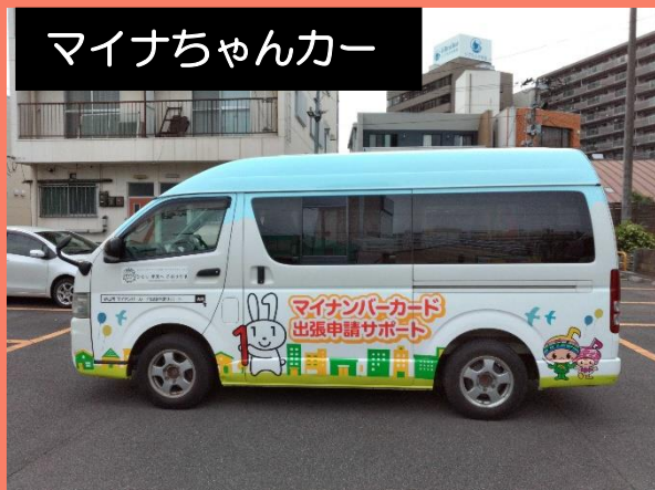
マイナちゃんカー

◎必要書類がない場合でも、代理での窓口受取等が可能ですので、受取方法についても併せてご相談ください。