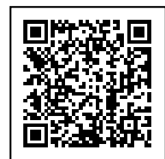
ウェブ申込用 QRコード

※申込者多数の場合には、抽選となります。 参加できるかどうかは 11月1日(水)までに結果をお知らせいたします。