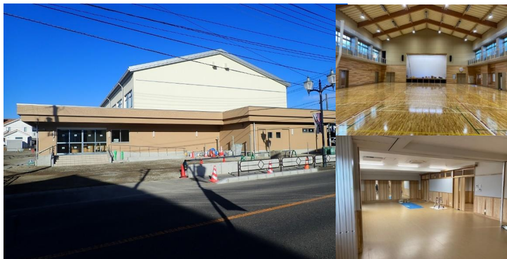
外観写真 2023（令和5）年10月13日現在