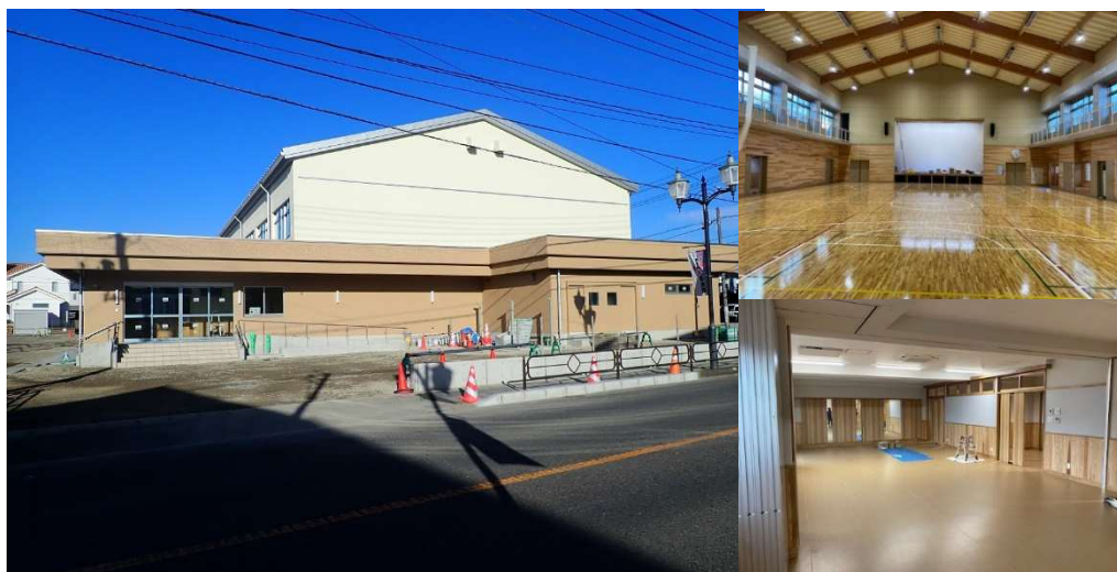
外観写真 2023（令和5）年10月13日現在