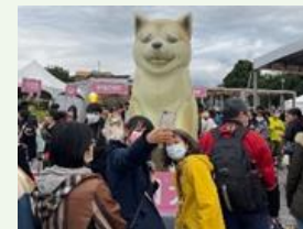
日本東北遊楽日2021年