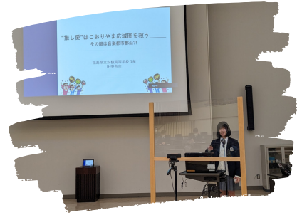
自分の発信力を磨こう