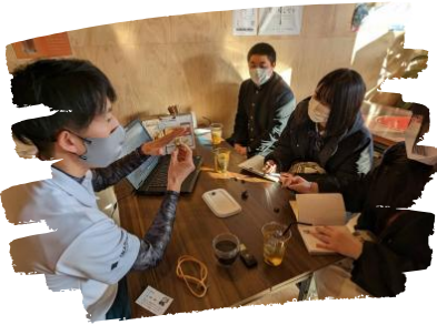
カッコいい大人との出逢い