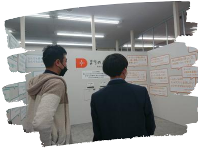
未知の世界との出逢い