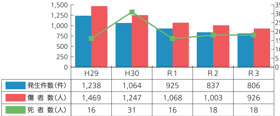
福島県警察本部の交通事故データより