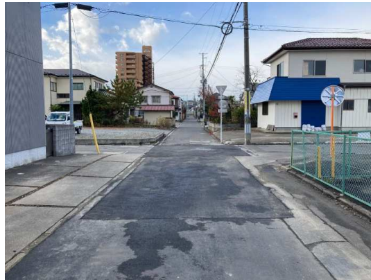
市道部舗装仮復旧完了