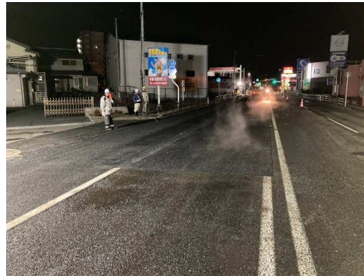
県道部舗装仮復旧完了