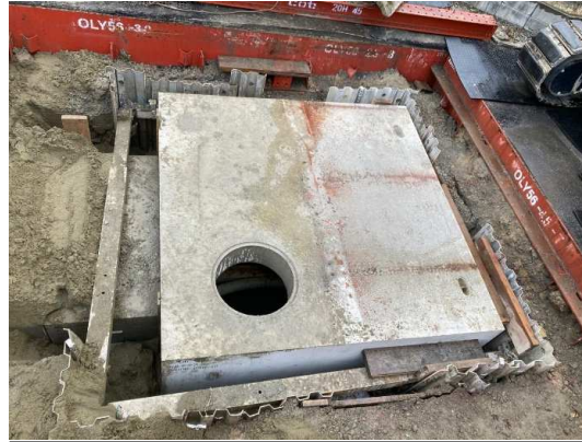
マンホール設置完了