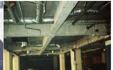
鉄骨を被覆して保護 石綿含有耐火被覆材