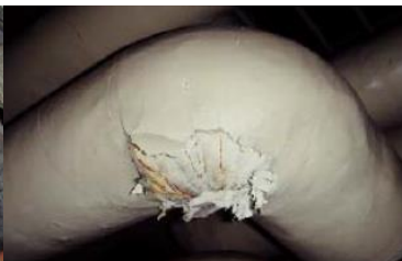
エルボ部に使用 石綿含有保温材