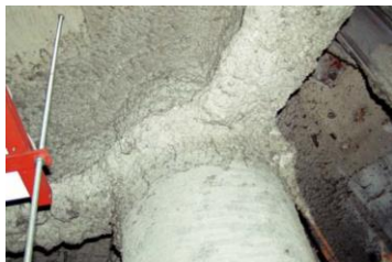
柱や梁に施工 吹付け石綿