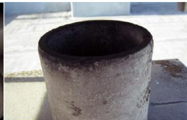
煙突の内側に使用 石綿含有断熱材