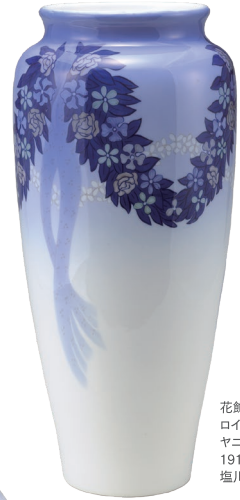
花飾文花瓶 ロイヤル コペンハーゲン ヤニー・ソフィー・メイヤー 1910年 個人蔵 塩川コレクション