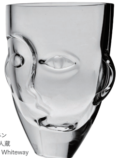
「ラムセス」花瓶 オレフォス マルティ・リッコネ 2000年頃 個人蔵