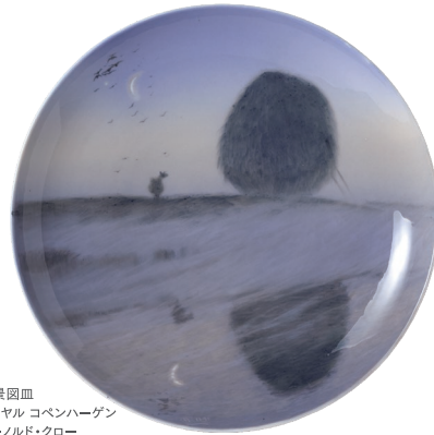
風景図皿 ロイヤル コペンハーゲン アーノルド・クロネ 1890年 塩川コレクション