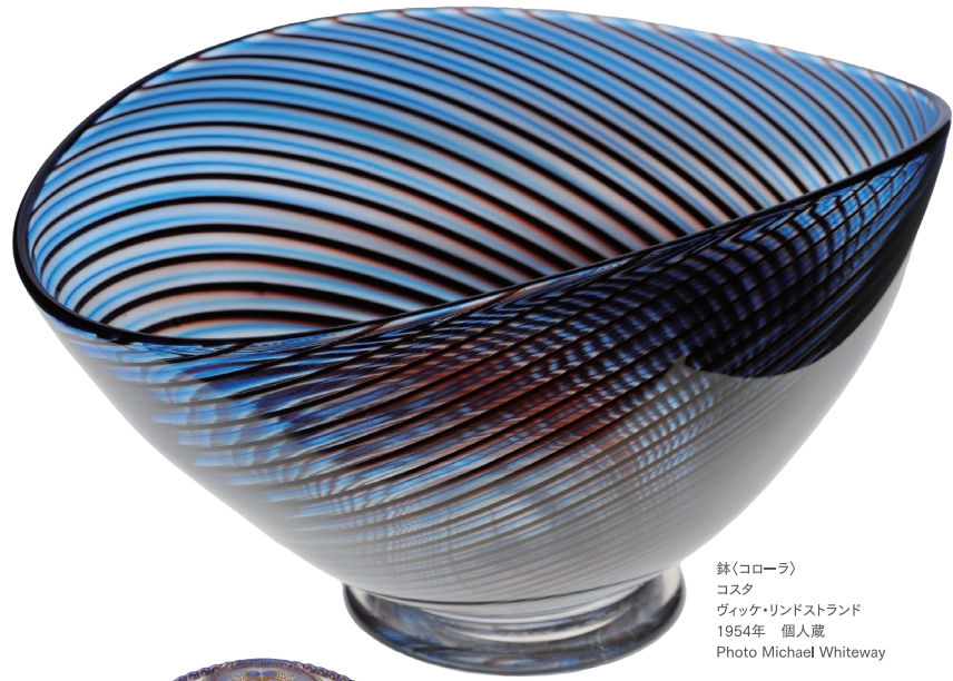
鉢(コローラ) コスタ ヴィック・リンドストランド 1954年 個人蔵

本展では、日欧のプライベートコレクションから約200点を選りすぐり、煌めく北欧のデザインをご紹介します。