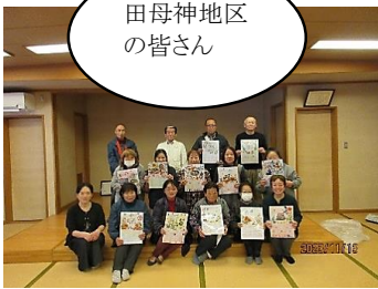
田母神地区の皆さん