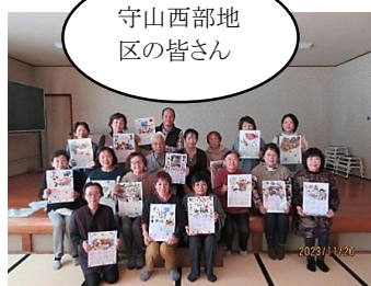
守山西部地区の皆さん