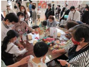
わくわくコーナー