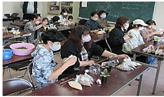
親子体験コーナー