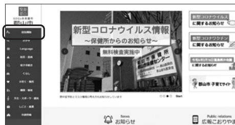
パソコン、タブレット画面