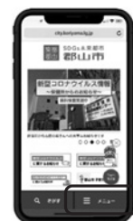
スマートフォン画面