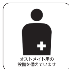
オストメイト用の 設備を備えています

https://www.mhlw.go.jp/stf/newpage_15684.html