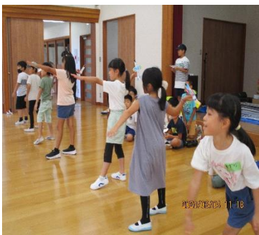
本格紙ヒコーキを飛ばそう (チャレンジ講座の皆さんとともに)