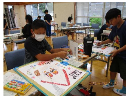
絵画教室(防火ポスターの制作)

■オセロゲーム大会は青少協主催で行いました。後日広報でもお知らせいたします。 なお、子どもたちの活躍の様子は赤木地域公民館の web ページや赤木地域公民館の Instagram でもご覧になれます。