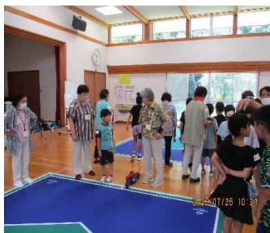
ポッチャ体験(あかぎの広場の皆さんとともに)