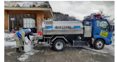
若山小学校での給水作業