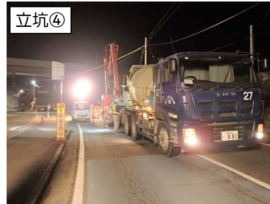
マンホール築造コンクリート打設状況