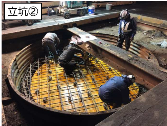
マンホール築造鉄筋組立状況