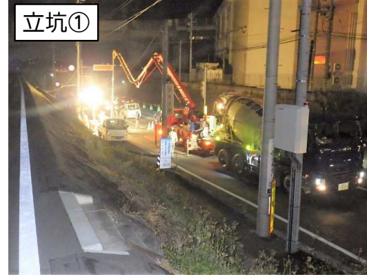
マンホール築造コンクリート打設状況