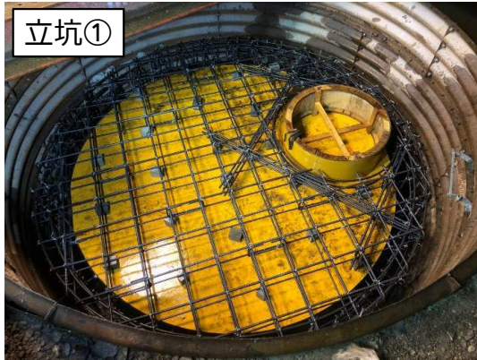
マンホール築造鉄筋組立完了

12月は、立坑①～④のマンホール築造などを行いました。 1月は、引き続き、立坑①～④のマンホール築造などを行います。