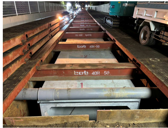
ボックスカルバート布設完了