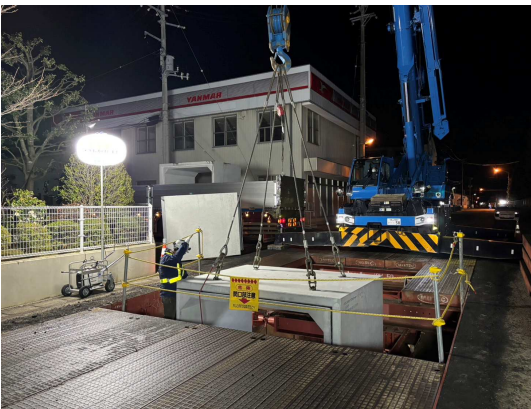
ボックスカルバート布設状況