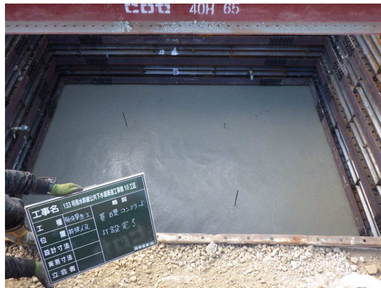
特殊人孔基礎コンクリート打設完了