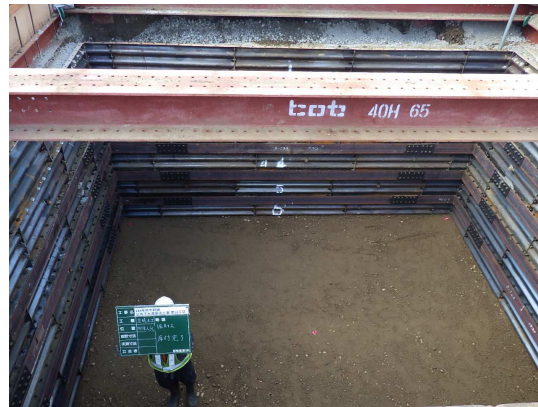
特殊人孔床付完了