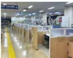
生活保護の相談窓口