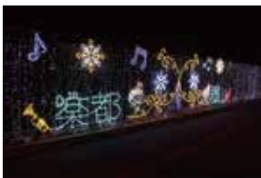
郡山駅東口のイルミネーション

答 工場が一体的、連続的に立地しておらず、観光スポットとしての魅力に欠けることや、安全面から工場の協力が得られない場合が考えられる。さらには、近隣住民の住環境への影響が懸念されること等から、現状では困難である。