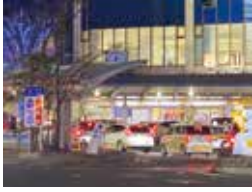
混み合う西口ロータリー

入口及びロータリー内の交差する部分は、一般車両を優先するよう、今後とも、郡山地区ハイヤー・タクシー協同組合に申し入れを行っていく。