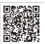
障がい者の福祉サービスと事業所

また、障がい福祉課においては、就労を希望する障がいのある人の職場体験実習の受け入れを行っている。