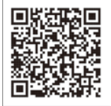
小原田貯留管・導水管築造工事

答 直径4m、長さ1千398m、貯留量1万7千570m 3 の貯留管を整備し、令和5年1月に供用開始したところであり、さらに貯留管への集水効果を高めるため、貯留管へ接続する導水管の整備を進めている。今年度策定予定の雨水管理総合計画を踏まえ、今後も、市内各地区の浸水対策に積極的に取り組んでいく。