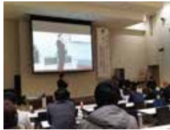
郡山商工会議所青年部主催 LGBT理解増進に向けたイベント

今後は、相談員養成講座の拡充や出前講座の利用を積極的に働きかけ、更なる相談窓口の支援や理解促進を進めるほか、国の基本計画に施策が示されるものと考えられるため、国の動向を注視していく。