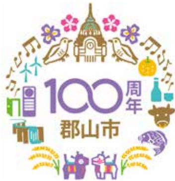
市制施行100周年記念 のロゴマーク

その後、採決の結果、郡山市行政センター設置条例の一部を改正する条例など議案47件を全会一致で、市制施行100