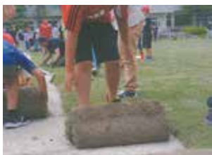
校庭の芝生化（米子市）

答 砂じんの飛散防止等の効果が期待できる一方で、整備費用や維持管理上の課題、土のグラウンド部分の減少による学習活動等への影響などがあると認識している。現在、校舎の長寿命化改修等を最優先に進めているが、気候変動に対応した体育館整備や校舎教室の空調設備の更新等、新たな課題があることから、校庭の芝生化は現時点では考えていない。