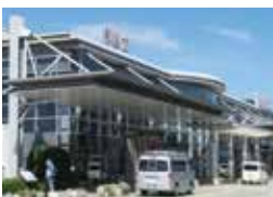
台湾との定期便が新規就航予定の福島空港

今後は、同ツアーで築いたネットワークや、SNSなどを通じて情報発信に取り組みとともに、公益財団法人日本台湾交流協会等、関係団体との連携を深め、本市経済の発展に取り組んでいく。