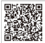
市まちづくり基本指針 (概要版)

答 次の100年を見据えて、予見可能性の高い課題へは、EBPMによる各種施策の展開が重要と認識しており、庁内に116名のEBPM推進リーダーを設置し、体制を強化した。今後は、長期的展望に基づき政策目的を明確化した上で、EBPMの実践による次期基本指針等の策定に努めていく。