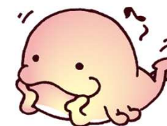
郡山市下水道キャラクター くまっち