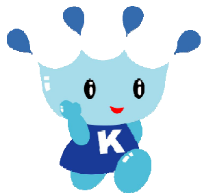
郡山市水道キャラクター きららん