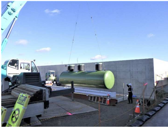
地下オイルタンク設置状況

12月は、地下オイルタンクの施工を行いました。 1月は、現場の片付けなどを行います。