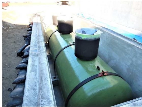
地下オイルタンク設置完了