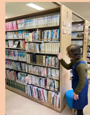
開架の郷土資料コーナー（貸出可）

このほかに「相生集」と「二本松市史」「二本松藩史」も人気のある郷土資料となっています。