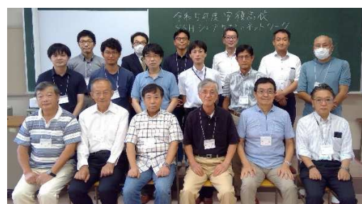
▲ 令和5年度のシニアサポーターの方々

〒963-8851 郡山市開成5-25-63 福島県立安積高等学校【TEL】024-922-4310