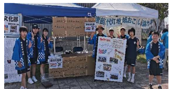
▲ 地元の祭りで取り組みを発信