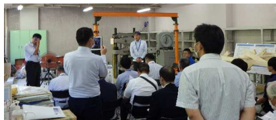
▲道路管理者立合いによる竹筋コンクリート荷重性能公開実験（日本大学工学部コンクリート研究室）