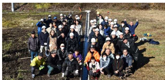
▲地域住民および協議会メンバー等による2次製品竹筋コンクリートU字溝の設置（南会津町）

〒963-8016 郡山市豊田町4-12 竹筋コンクリート協議会【TEL】024-927-4471