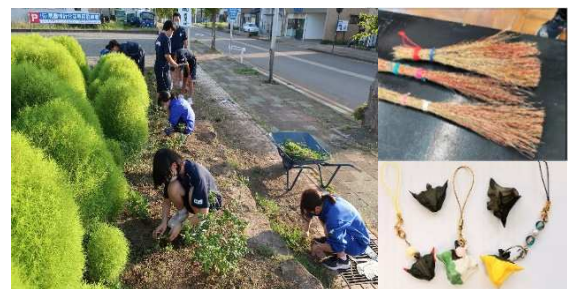
▲ 資源をムダにしない取り組み