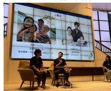
▲ 男性育児休暇取得のイベントを開催

〒963-0215 郡山市待池台2-8 ノボノルディスクファーマ株式会社郡山工場 【TEL】 024-959-5100