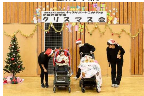
▲クリスマス会の様子

〒963-8061 郡山市富久山町福原字東17 東北健康福祉株式会社【TEL】024-973-8251