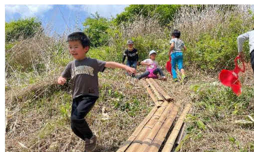
▲自然体験イベントの様子