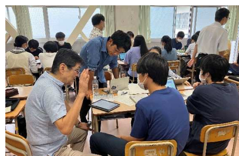
▲ 探究活動とシニアサポーターの指導