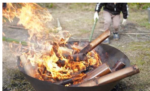
▲活用し終えた竹を炭にして再利用

〒963-4313 田村市船引町石森字館108 一般社団法人Switch 【TEL】 0247-61-7575