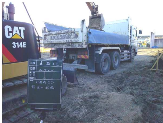
掘削土砂積込・運搬状況