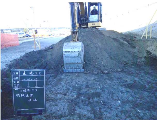
補強土壁工(掘削・床掘)状況

12月は、都市計画道路笹川大善寺線の補強土壁工に係る掘削・床掘に着手しました。 1月は、補強土壁工に係る基礎コンクリート工及び補強盛土工等を施工します。