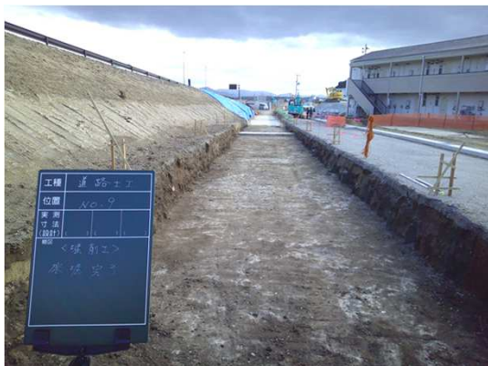
補強土壁工(掘削・床掘完了)施工状況