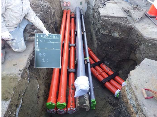
電線共同溝(管路部)施工状況