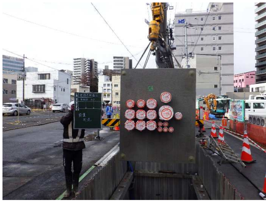
電線共同溝(特殊部)施工状況