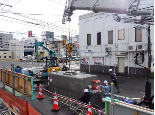
電線共同溝(特殊部)施工状況