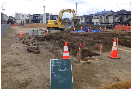
遊具(3連鉄棒)設置箇所基礎工(掘削)状況