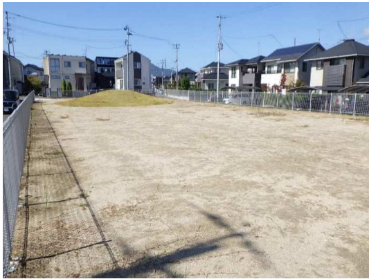
遊具(3連鉄棒)設置箇所状況(10月施工前)

11月は、遊具(3連鉄棒、2連ブランコ)の基礎工(掘削)に着手しました。 12月は、遊具(3連鉄棒、2連ブランコ)の基礎工(型枠及びコンクリート打設)を施工します。