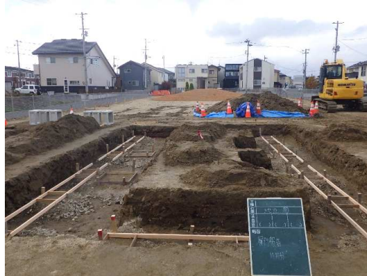
遊具(2連ブランコ)設置箇所基礎工(掘削)状況