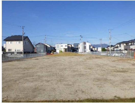
遊具(2連ブランコ)設置箇所状況(10月施工前)