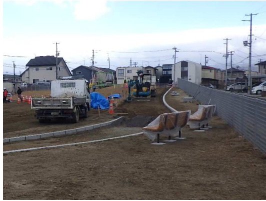
ベンチ設置及び園路施工状況