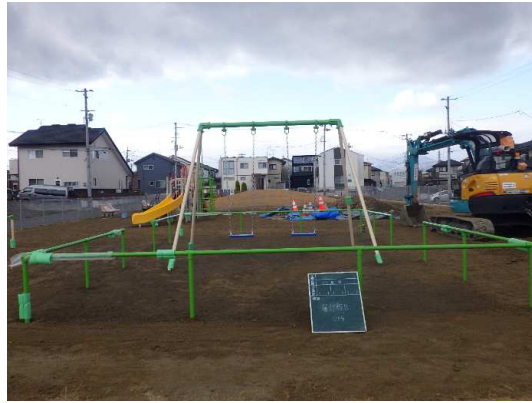
遊具(2連ブランコ)設置状況