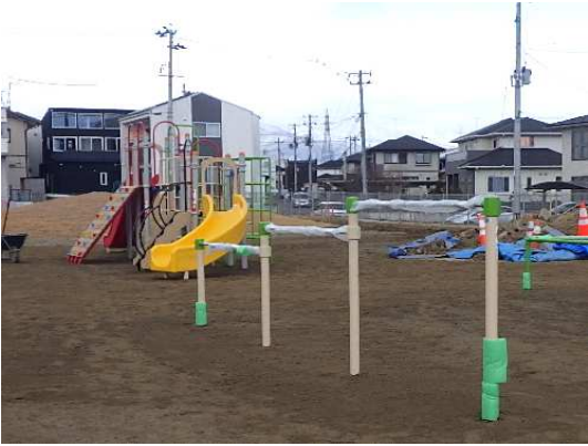
遊具(複合遊具、3連鉄棒)設置状況

12月は、遊具(複合遊具、3連鉄棒、2連ブランコ)及びベンチ設置を行い、園路の施工(地先境界ブロック設置)に着手しました。 1月は、引き続き、園路の施工を行い、水飲み場設置に着手します。