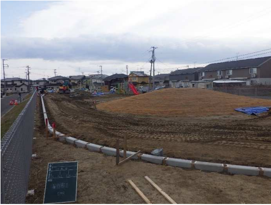
園路施工(地先境界ブロック設置)状況