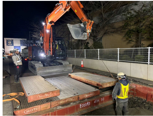
覆工板・土留撤去状況