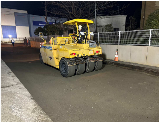
埋戻し・路盤転圧状況