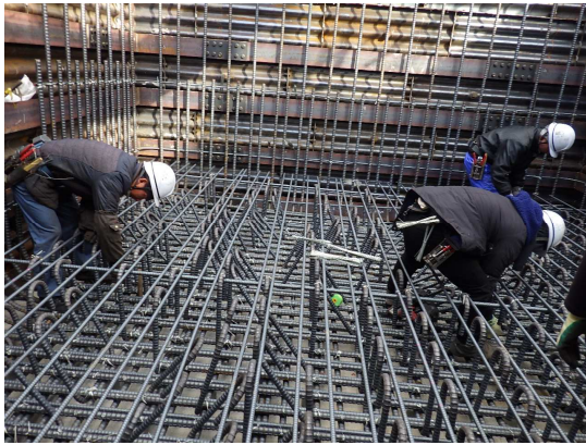
特殊人孔鉄筋組立状況

1月は、特殊人孔築造及びボックスカルバート部の掘削、切梁・腹起し、基礎工を行いました。 2月は、引き続き、ボックスカルバート部の掘削、切梁・腹起し、基礎工を行います。