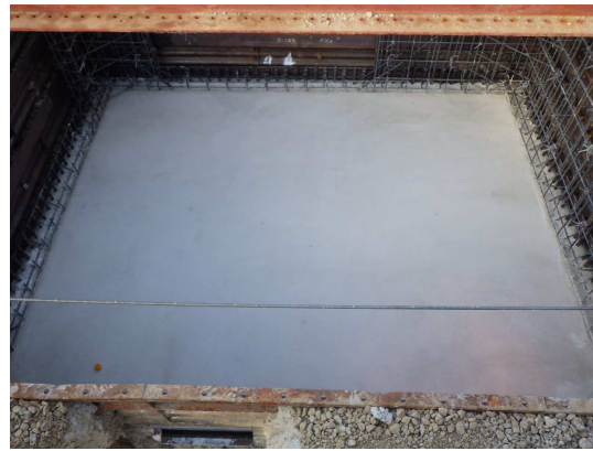
特殊人孔底版完了