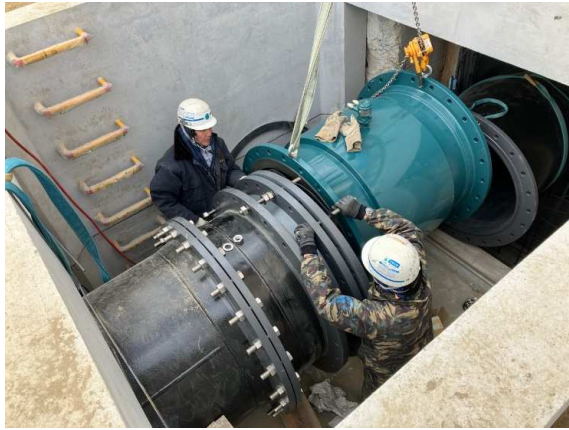
バイパス管布設状況