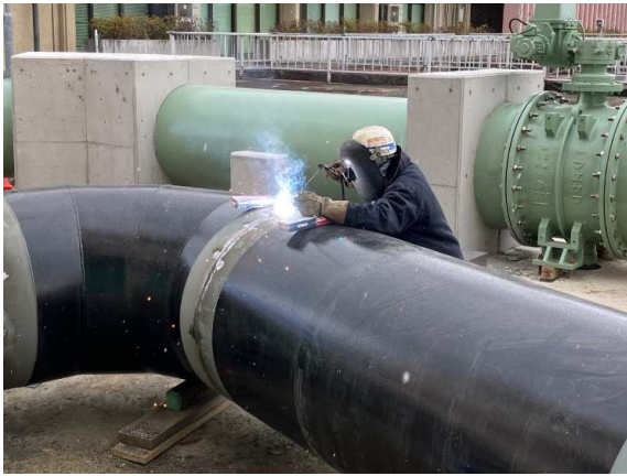
バイパス管溶接状況

1月は、バイパス管の築造を行いました。 2月は、引き続き、バイパス管の築造を行います。