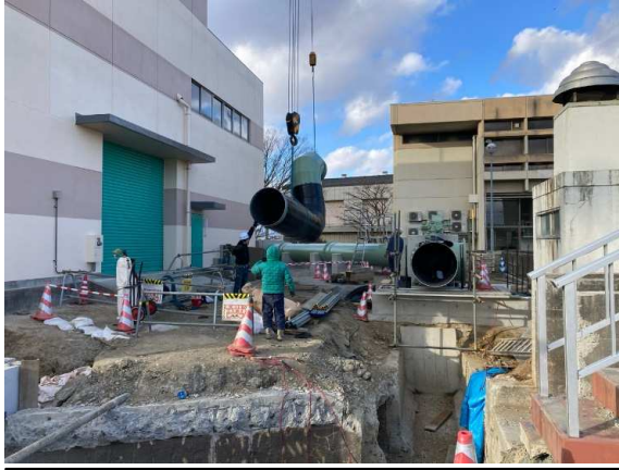
バイパス管布設状況