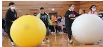
(大玉ころがし：呼吸をあわせてえ～)