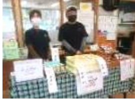
(スイートホットさんのおいしいスイーツ)