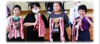
(優勝、準優勝、3位カップとったぞ～！！)