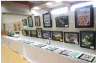
(見事な作品が数多く出展)