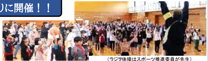
(ボールリレー：早く早く)