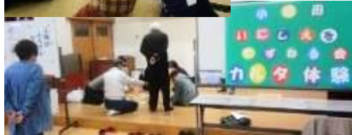
(ふるさとカルタ子ども大会と一般体験会)