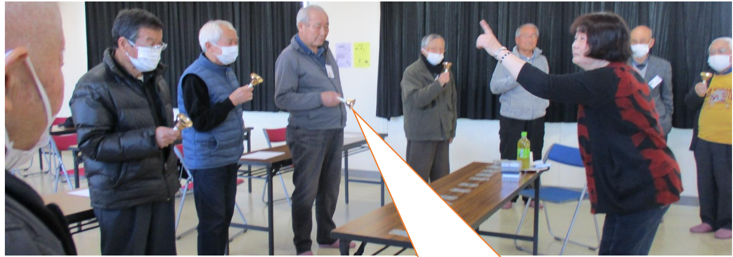
R6年度 やってみたい講座を受講生で考えました。