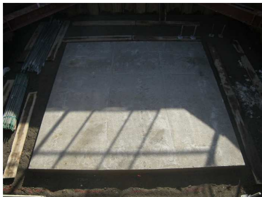
基礎コンクリート完了

2月は、特殊人孔の築造を行いました。 3月は、引き続き、特殊人孔の築造を行います。