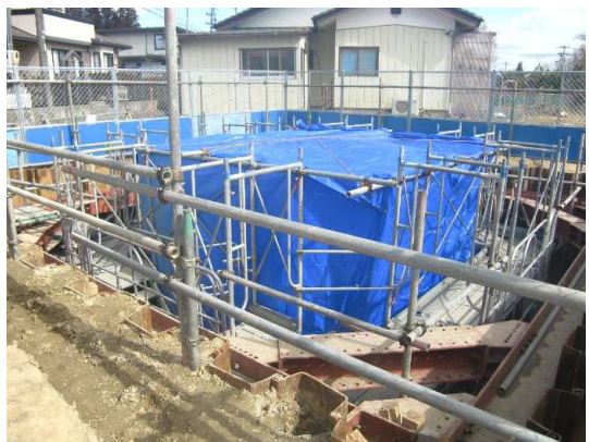
コンクリート養生状況