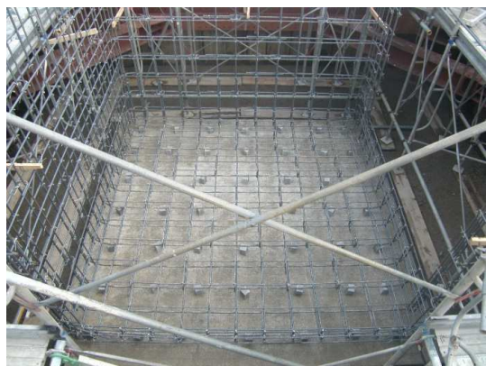
底板鉄筋組立完了