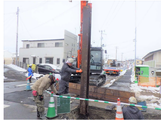
仮設土留設置状況