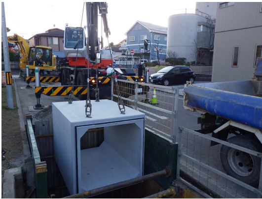
ボックスカルバート布設状況

2月は、ボックスカルバートの設置、特殊人孔の仮設土留及び覆工板の設置を行いました。 3月は、特殊人孔の築造を行います。