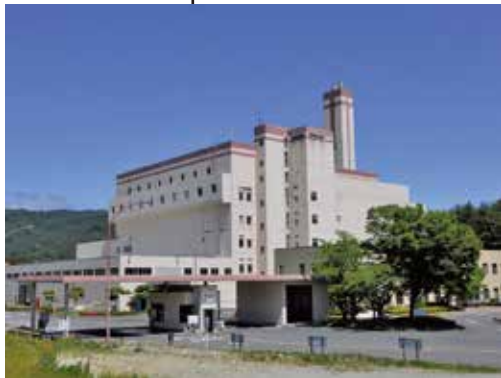
こう ず 河内クリーンセンター