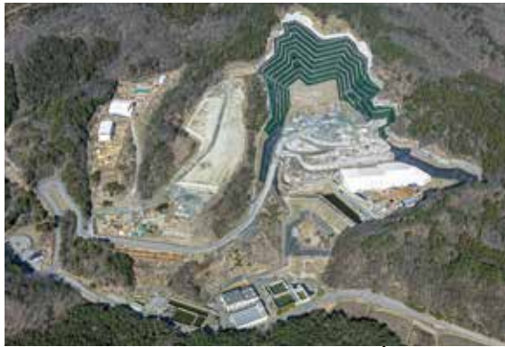
こう ず うめ たて しょ ぶん じょう 河内埋立処分場