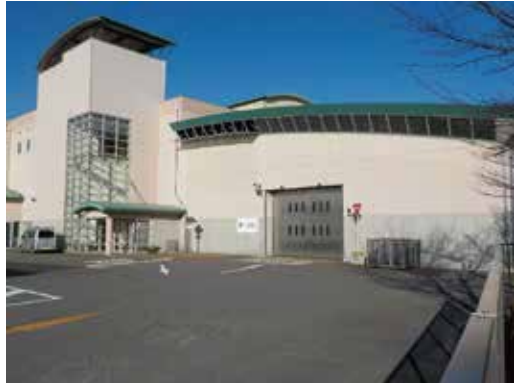
リサイクルプラザ