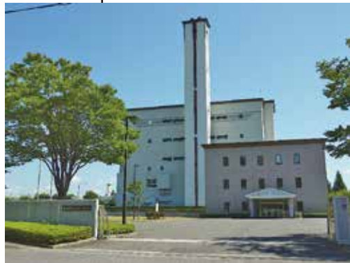
ふ く やま 富久山クリーンセンター

令和 6 年度 わたしたちとごみ リーフレット版 発行 郡山市 編集 環境部5R推進課 〒963-8601 郡山市朝日一丁目23-7 TEL 024-924-2181 FAX 024-935-6790 印刷 (株)やまと印刷